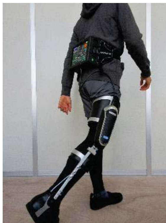
(右) 本機器を KAFO (長下肢装具) に装着した様子