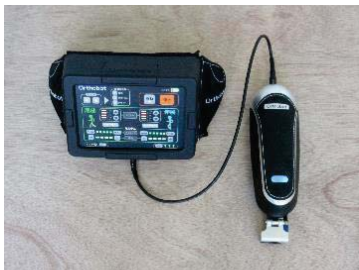
(上) 「Orthobot」本体ユニットと腰ベルトユニット

Orthobot は、歩行に何らかの障害を抱える人々の歩行リハビリテーションを補助する装着型アシストロボットです。従来のリハビリテーションロボットは装着に時間がかかり、専門家による設定が必要であるなど、専門家のいない介護現場では利用が困難でした。本機器はモーターとセンサーを内蔵した本体ユニットを、使用者が歩行リハビリテーションにおいて KAFO (長下肢装具) に取り付けるだけで、装着者の歩行を本来あるべき歩行運動に誘導することができます。本機器を使用することにより、歩行が不安定になった方に対して、簡便に正常な歩行を体験させることが可能になります。